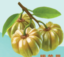
藤黄果 GARCINIA CAMBOGIA HCA