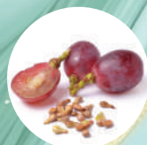
葡萄籽 GRAPE SEED