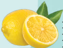
柠檬酸 CITRIC ACID