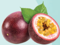
百香果 PASSION FRUIT