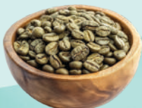
绿咖啡豆 GREEN COFFEE BEANS