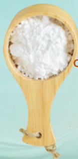
低聚果糖 FRUCTO OLIGOSACCHARIDES